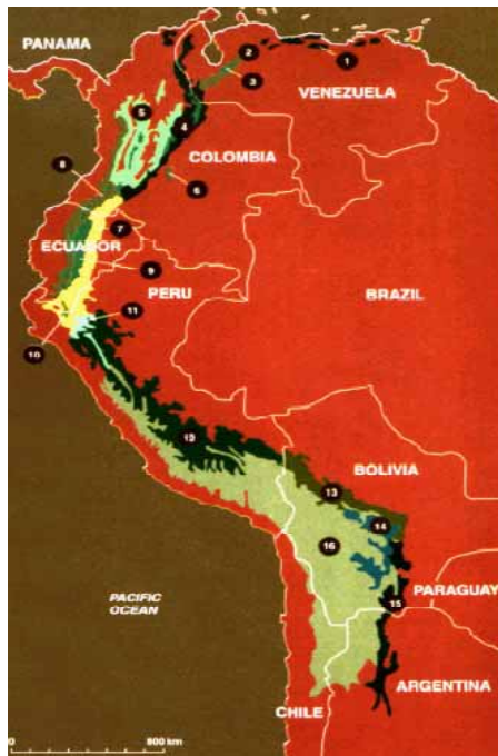
Hot Spot Andes Tropicales