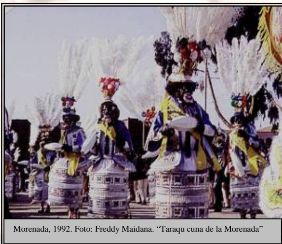
Morenada, 1992. "Taraqu cuna de la Morenada"

Complementando la riqueza turística están las manifestaciones culturales folklóricas y las transmitidas de generación en generación mediante leyendas y narraciones (patrimonio intangible).